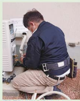
親切・丁寧な施工を心がけています

高齢化社会が進む中、特に高齢者からの家電に関する相談が急増しています。省エネ家電はもちろんのこと、災害時に役立つ太陽光パネルや蓄電池、エコキュートの導入もオススメです。家電の販売や修理、電気工事など、さまざまな相談に迅速・丁寧にお応えいたしますので、何かお困りごとがございましたら、ぜひ当地域の電機商業組合員までお問い合わせください。