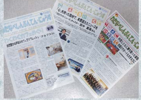
しんぶんてん・にゆうすは2022年11月で212号になります