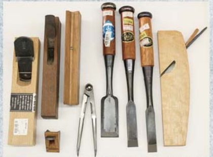
かつて使われていた数々のカンナ、ノミ

長い年月継承されてきた家業を、初心に戻りつつも様々な情勢に合わせ変化を恐れず、地域の皆様のお役に立てられるような商いを心がけていきます。