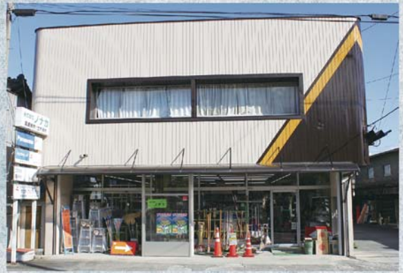
現在の社屋 南アルプス市古市場501