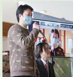
2022年2月22日に開催した「No.2サミット」

芦安地域の宿泊業同士が手を取り合い、南アルプス市の観光地としての発展と地域の未来、また会員相互の親睦を深めることを目的に設立された歴史ある会です。主に観光PRを目的としたイベントを企画・開催して来ました。昨年度は、南アルプス市に日本で2番目に高い山北岳があることから、さまざまな分野の「2番目」を持つ自治体や団体などと繋がるイベント「No.2サミット」を地元団体と共同開催し、コロナ禍でも出来る観光魅力発信を行いました。引き続き南アルプス観光を盛り上げる為、様々な分野の方々と連携協力しながら、会員一丸となって取り組んで参ります。