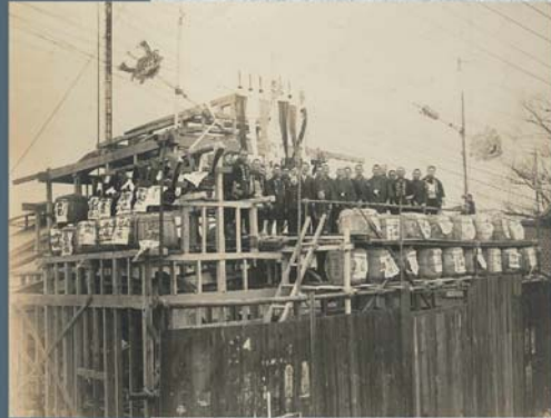
昭和3年頃 野中材木店甲府支店の建前