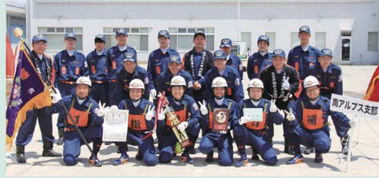
今年10月29日(土)に千葉県において開催される全国大会に出場します!!

令和4年7月24日に開催した第53回山梨県消防団員操法大会で 櫛形分団第3部・第6部が優勝!