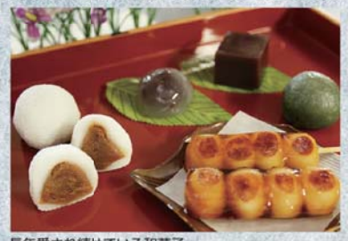
長年愛され続けている和菓子

地域のお客様にいつまでも変わらない味を「美味しい」と言ってもらえるようにこれからも先代からの菓子製造技術や味を継承していきます。 近年は、原材料の高騰などで菓子製造業界は大変な時ではありますが、お客様がお菓子を食べて笑顔になれるような心を込めて作っていききたいと思います。