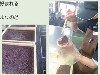
あんこ炊き修行は10年。夏仕様・秋仕様・冬仕様と炊き分ける