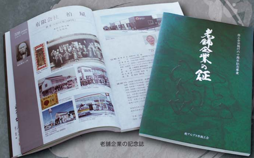
老舗企業の記念誌

南アルプス市商工会は、商工会法施行六十周年を記念した事業の一環で、市内で六十年以上経営を続けている企業を紹介する記念誌「老舗企業の証」を制作しました。 関係企業に配布をしたほか、市内の公共施設に寄贈いたしました。