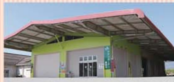
アグリガーデン東部店

令和4年4月1日、JA南アルプス市は購買店舗を集約し、アグリガーデン(拠点型経済店舗)4店舗としてスタートしました。既存のアグリガーデン北部店・南部店に加え、東部店・西部店が新たにオープンしました。従来の購買店舗よりも多くの商品を取り揃えており、売場面積も広がっています。アグリガーデン東部店は、旧鏡中条共選所を改修した店舗です。共選所の大きな屋根を活かし、店舗をぐるっと囲うように車両用の通路を設置しております。店舗から車まで濡れずに積み込みが出来るようになり、雨の日でも安心してお買い物出来ます。アグリガーデン西部店は、曲輪田購買店舗を改修した店舗です。倉庫として使っていた部屋を拡張し、資材売場としてリニューアルしました。ガソリンスタンド、ATMは変わらず併設しているので、一度で用事を済ませることが出来ます。ぜひ新しくなったJAのアグリガーデンに足を運んでみて下さい。