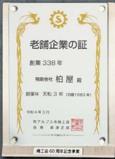
老舗企業の証プレート

長年にわたり地域社会や経済の発展に寄与した企業を「老舗企業」として称え、地元での事業継続への機運を醸成しようと初めて企画しました。市内で創業、または支店や工場を開設し、二〇二三年三月末時点で六十年以上事業を営む企業や事業所を募集しました。 記念誌では、市内で三百三十八〜六十二年間経営を続ける四十八の企業を掲載しました。沿革や創業者、現在の代表者の顔写真、受け継がれている経営理念などを紹介しています。創業当時の写真や使用していた道具、商品の写真や資料なども掲載しています。同時に商工会六十周年の歩みや活動も紹介しています。 記念誌はA4判カラーで百四十四ページ、三百冊制作し、三月十六日に桃源文化会館で開催した老舗企業顕彰式典で掲載企業に配布し、市内の小中学校や図書館などにも贈りました。 ぜひ、図書館等でお手にとりいただき、昔の商売の様子や市内の経済発展に貢献した企業を、ご覧ください。