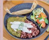
ルンダン風カレープレート