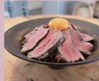
ローストビーフ丼