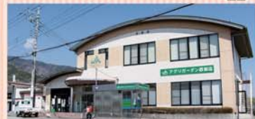
アグリガーデン西部店

住所:南アルプス市寺部1336 TEL:055-283-4448 営業時間:(4月~9月)8:00-19:00 (10月~3月)8:30-18:00 定休日:年末年始、樹卸日