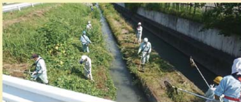
(夏の河川除草作業)

会員建設業者の資質の向上を図り、建設業を技術的・経済的および社会的に向上させ、公共の福祉と会員相互の親睦と融和を図るとともに、南アルプス市建設行政に協力することを目的に設立しました。