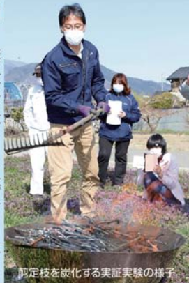
剪定枝を炭化する実証実験の様子

JA南アルプス市は、このたび山梨県が行う全国初の認証制度「4パーミル・イニシアチブ農産物認証制度」にてエフォート(取り組み・計画)認証を受けました。「4パーミル・イニシアチブ」とは、世界の土壌の炭素量を毎年0.4%(4パーミル)増やす事が出来れば、大気中のCO2の増加分を相殺し、温暖化を抑制できるという国際的な活動で、2020年12月現在、日本国を含む566の国や国際機関が参画しています。山梨県は昨年からの活動を積極的に進めていて、JA南アルプス市もこの活動に賛同し、ブドウや桃などの果樹の剪定枝を炭化する実証実験などを行っています。JA南アルプス市はこれからも安心・安全で環境に優しい農作物を生産して行きます。