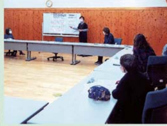
改善計画を語る会議