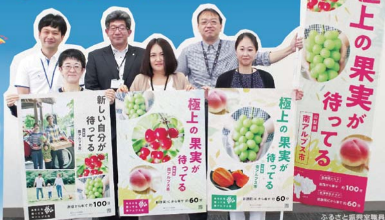
ふるさと振興室職員