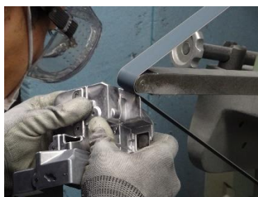
<サンダーによる細部バリ取り>