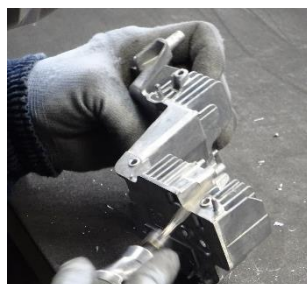
<特殊工具による仕上げ>