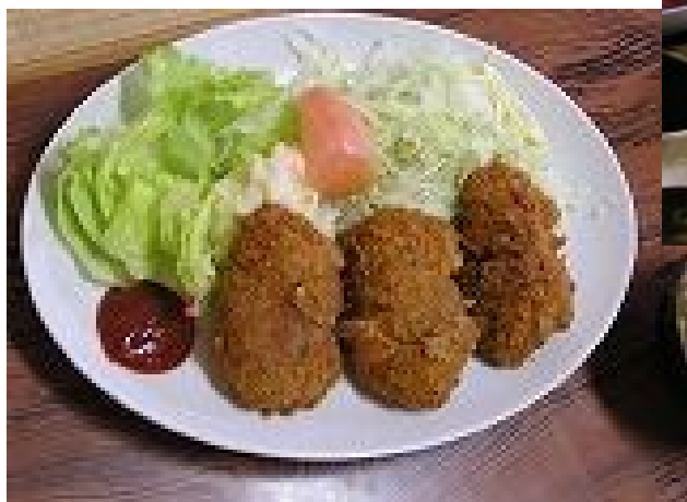
お肉がやわらか〜い ひれかつ

会員さんともっと近くに・・・との思いで代行先事業所を訪問させて頂きました。 今回は、甲西工業団地に近い住宅地にある飲食店、 とんかつ かつ金 さんです。ランチメニューには お魚もあります。【ランチ 800～900 円・かつ金定食 1850 円 ほか】 材料の仕入れは気を遣い厳選、すべて手づくりで注文をいただいてから調理をはじめます。 店主より「本当に良いものを・・・おいしい料理を食べていただきたい」と。食事をいただいて、 お気持ちが伝わりました！！