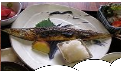
今が旬！ サンマ定食

〜かつ金さんより記帳センターへひとこと〜 いつも会計の仕事をお願いしています。日々 の仕事の中で会計や決算は細かい仕事なので とても助かっています。これからもよいアドバ イスよろしく願います。 店主より