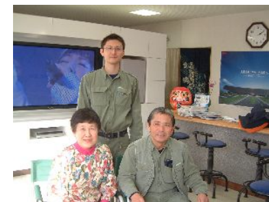
奥さん・卓也さん・ご主人