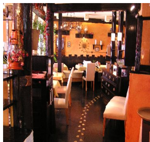
ファミリーな感じの店内