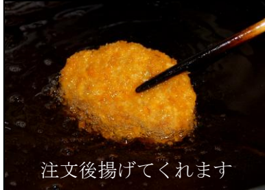
注文後揚げてくれます

揚げ物は作り置きをせず、注文を受けてからその場で揚げしてくれます。お客さんのなかには揚げたてを1つ食べながら帰る、なんて方も。1日限定、コロッケは約80個、メンチカツは50個程。電話での注文も受け付けています。受験シーズンでは豚カツが大人気。食べれば合格成就すると評判のカツです。そして記帳センター長のいち押し、馬のもつ煮は柔らかくてとってもヘルシー。30年変わらない人気の味です。おいしい肉と安全にこだわった品々を、是非召し上がってみて下さい。