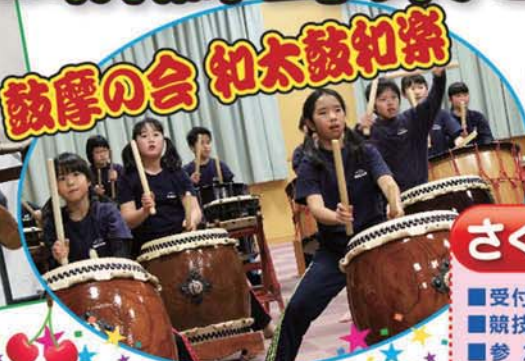
鼓摩の会 和太鼓和楽