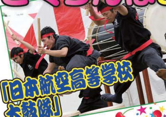
「日本航空高等学校 太鼓隊」