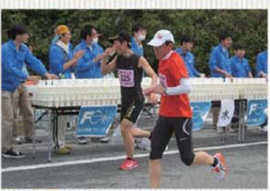
第14回桃源郷マラソンでの給水所

富士電機株式会社は、主に産業・社会インフラ分野においてパワーエレクトロニクス関連の電気機器を幅広く手掛ける、日本を代表する電機メーカーです。山梨製作所は平成3年に飯野地内に設立し、雄大な富士を望む敷地面積16万㎡の工場では、電気機器の電力コントロールに必要な「パワー半導体」の素子(チップ)を社員100名で製造しています。パワー半導体は、「緑の下の力持ち」として家電からパソコン、自動車・鉄道・工作機械など様々な機器に使われ、省エネ化や高効率化の重要な役割を担っています。また山梨製作所は、毎年桃源郷マラソンに特別協賛(ゼッケン Sponsor)し、今大会からは敷地内に給水所を設け参加者をサポートするなど、地域貢献にも取り組んでいます。