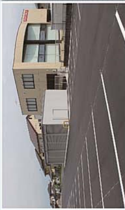
駐車場、約50台収容可能な駐車場が併設