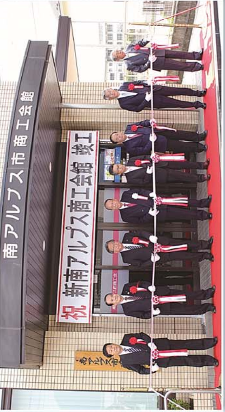
テープカット・知事代理、市長をはじめとする8名によるテープカットで新スタート

日間の連休中に職員20名が総出で引越し作業を懸命に行い、5月7日(月)より平常業務に入りました。 5月7日(月)には朝7時30分に会長、副会長立会いの中、神事を行い商工会館での業務が安全かつ発展できるようお祈りを捧げました。 5月12日(土)には、山梨県知事、南アルプス市長など約80名の来賓の出席をいただき、正面玄関にてテープカットを行い、2階ホ