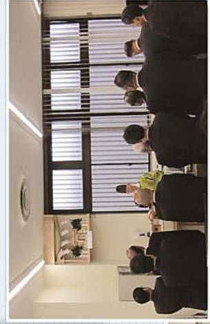
神事5.7今後益々発展するよう祈念しました

ールにて竣工式が挙行されました。 竣工式に続き、祝賀パーティーも開催し、新商工会館の完成を祝っていただきました。 この新商工会館は、市商工業振興の新拠点となり、役職員一同気持ちを新たにし、会員の皆様が発展できるよう鋭意行動して参りますので、宜しくお願い申し上げます。