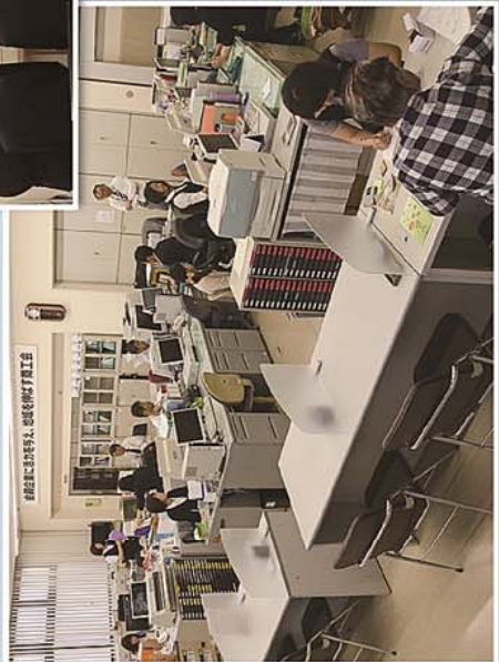
事務所風景・会員にとっても利用しやすくなった「随事務所